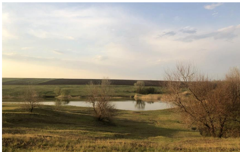
Фото 1. Краєвид біля села Берестове Близнюківського району Харківської області.