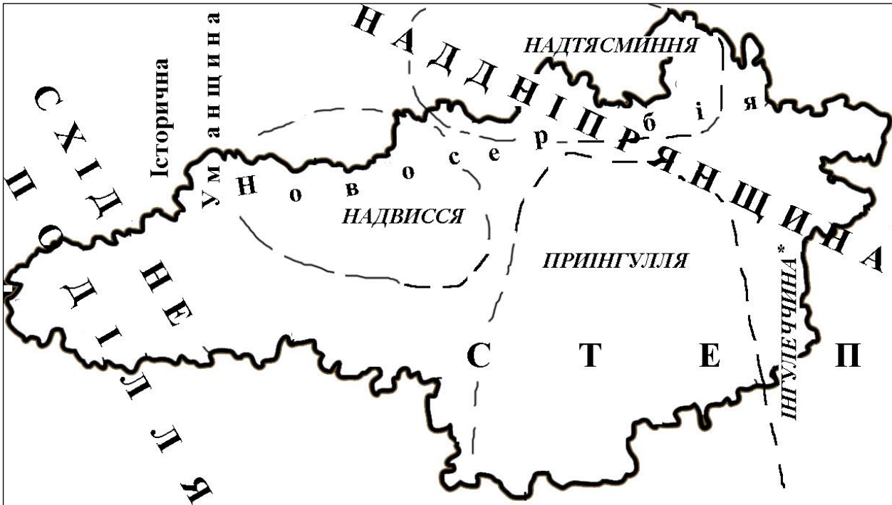
Картосхема 1. Фізико-географічне й історико-етнографічне районування Кіровоградської області

*Дещо сумнівна з філологічного погляду форма на позначення теренів у басейні річки Інгулець, на разі користуємося нею як робочою.